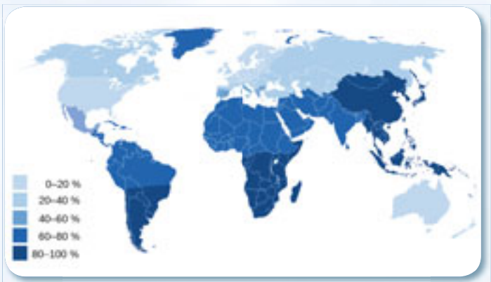
Weltweite Verteilung der Laktoseintoleranz

Der Köln Smelk® Haferdrink schmeckt pur ebenso lecker wie in Müslis, Milchshakes, süßen Hauptspeisen oder Desserts und kann immer dann eingesetzt werden, wenn Kuhmilch nicht in Frage kommt. Ferner ist Köln Smelk® mit Calcium angereichert und kann damit einen wichtigen Beitrag zur täglichen Calciumzufuhr leisten.